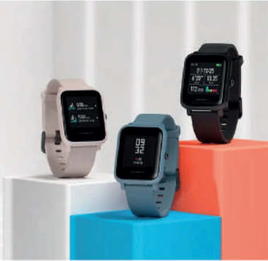
Amazfit Bip Lite Smart Watch